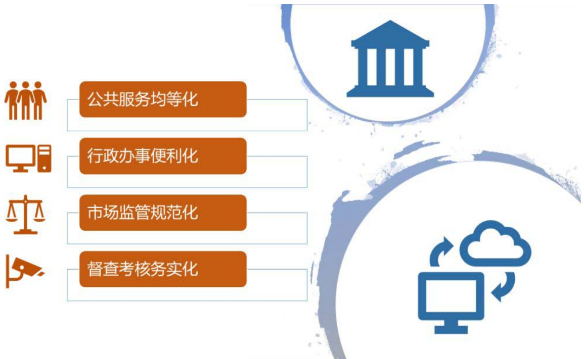
图3 互联网技术驱动政府治理变革的四个维度

第二，借助互联网优化政府流程，推动行政办事便利化，实现“数据多跑路，群众少跑腿”。2019年《报告》重申并再次强调了这方面的内容，指出要以简审批优服务便利投资兴业，推行网上审批和服务，加快实现一网通办、异地可办，使更多事项不见面办理，确需到现场办的要“一窗受理、限时办结”“最多跑一次”。