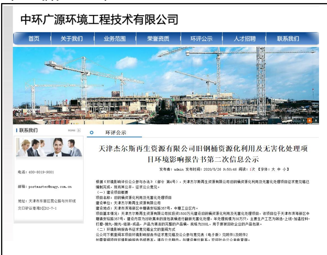
图2 网上公众参与第二次信息公示截图

http://www.tjqhj.com/Index.asp , 公示截图如下。