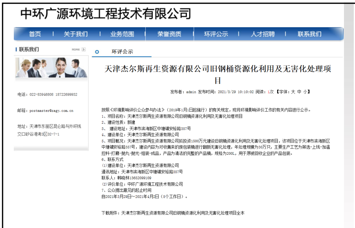
图 5 报批前报告全本公示信息截图