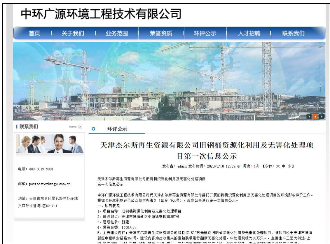
图1 网上公众参与第一次信息公示截图

建设单位在中环广源环境工程技术有限公司网站上公示了本项目的相关信息，网址为： http://www.tjqhj.com/Index.asp ，公示截图如下。