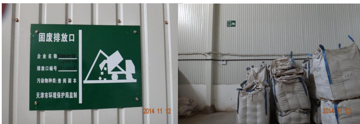
固体废弃物暂存地规范化标识牌