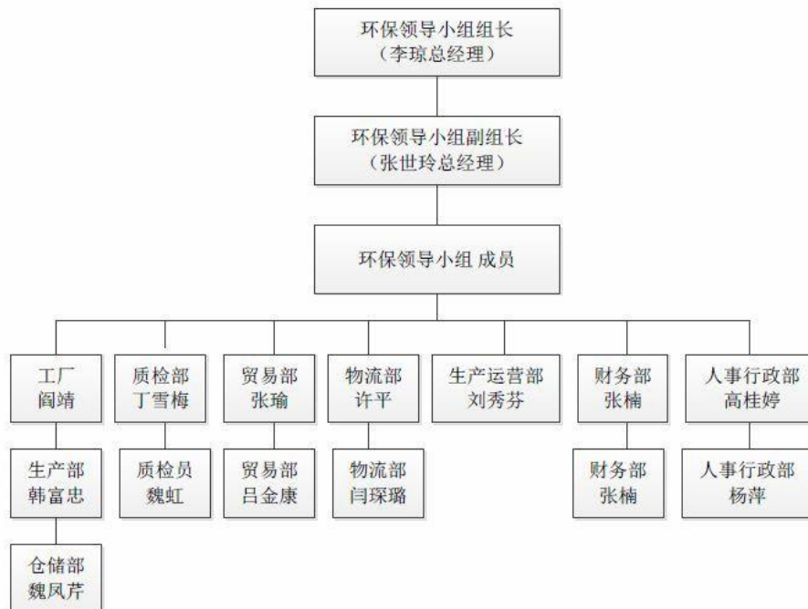
阿联斯谷物贸易（天津）有限公司 环保机构设置图

12.3.2 环境管理规章制度 公司制定了《环境保护管理制度》，文件涉及具体内容包括环保规章制度、环保