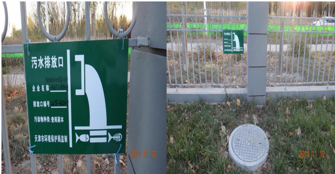
污水排放口规范化标识牌