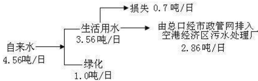
图 5.1 本项目水平衡图