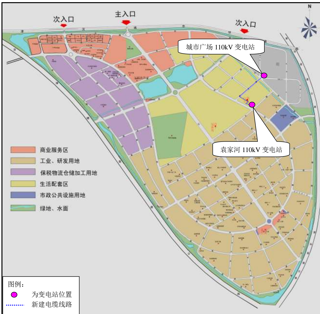
附图 1 建设项目地理位置图